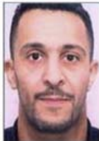
Brahim Abdeslam (Dead)