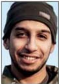
Abdelhamid Abaaoud (Dead) Suspected ringleader