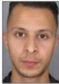
Salah Abdeslam (Arrested)