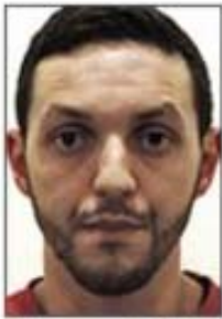
Mohamed Abrini (Wanted)